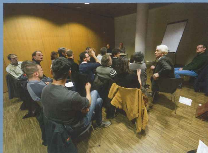
Gregory Sajdak © CNPF