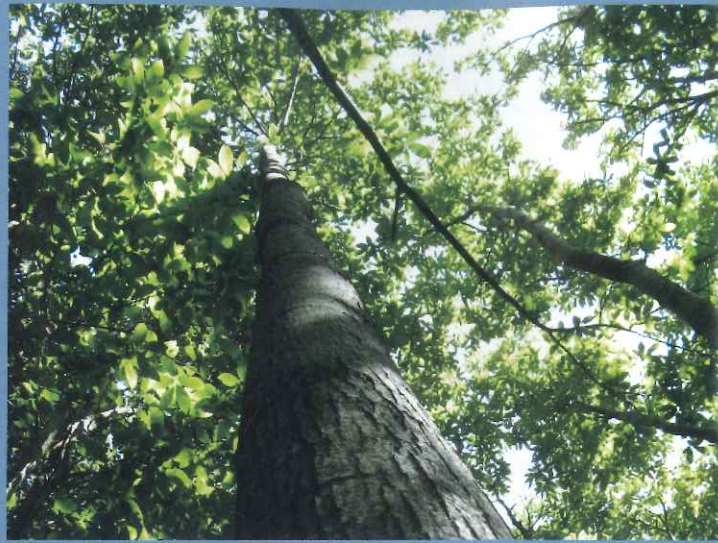
Belle grume de châtaignier dans les Cévennes.

Catalogue de l'Institut pour le développement forestier consultable sur le site www.foretpriveefrancaise.com et gratuit sur simple demande