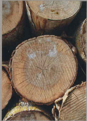
Billons de châtaignier, Dordogne.

Numéro suivant N° 232 Les expérimentations de la forêt privée, pourquoi, comment ?