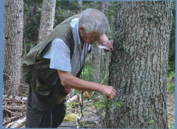
Futaie irrégulière de sapin dans le Vercors.

Chèque bancaire ou postal à l'ordre de : « agent comptable CNPF » à retourner à la librairie de l'IDF, 47 rue de Chaillot, 75116 Paris - Tél. : 01 47 20 68 15 Fax : 01 47 23 49 20 - idf-librairie@cnpf.fr Catalogue de l'Institut pour le développement forestier consultable sur le site www.foretriveefrancaise.com et gratuit sur simple demande