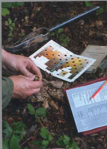
Observation et description du sol en champagne-Ardenne.