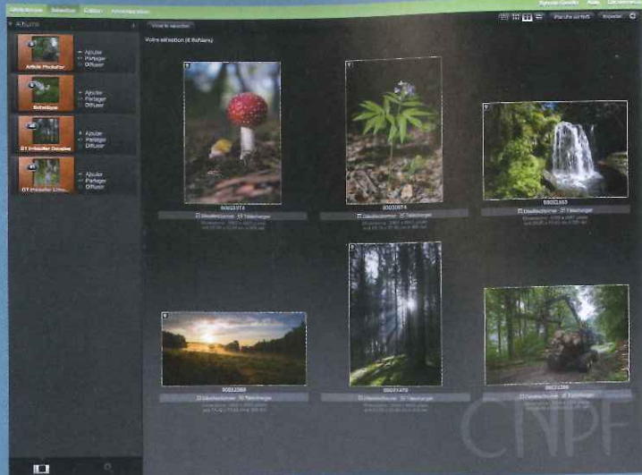
PhotoFor : une interface fonctionnelle pour rechercher, sélectionner et télécharger des photos forestières.

Chèque bancaire ou postal à l'ordre de : « agent comptable CNPF » à retourner à la librairie de l'IDF, 47 rue de Chaillot, 75116 Paris — Tél. : 01 47 20 68 15 Fax : 01 47 23 49 20 — idf-librairie@cnpf.fr Catalogue de l'Institut pour le développement forestier consultable sur le site www.foretpriveefrancaise.com et gratuit sur simple demande