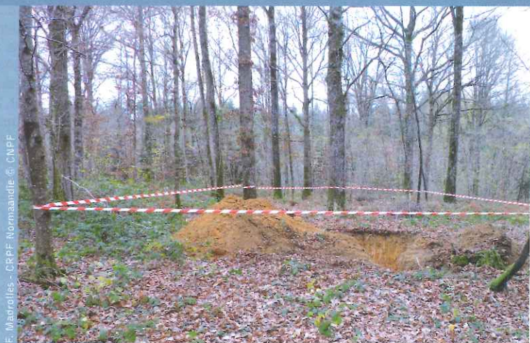
F. Madrolles - CRPF Normandie © CNPF

> 39 Les stations forestières : intérêts et limites des cartographies prédictives et par échantillonnage Sylvain Gaudin, Christian Piedallu, Florentin Madrolles et Jean-Baptiste Reboul