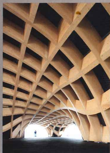
Le Pavillon France à l'Exposition universelle de Milan (Italie) conçu par l'agence d'architecture X-TU de Paris, est construit par l'entreprise Simonin (Doubs) en bois issu des forêts franc-comtoises.

Numéro suivant N° 225 Les systèmes agroforestiers : diversité des pratiques, intérêts économiques et environnementaux