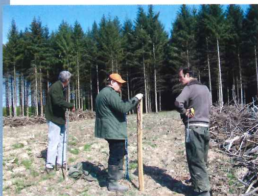
Installation d'un dispositif Nomades (28).