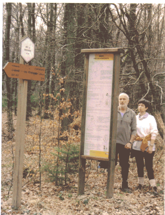
Promenade balisée à Nassogne

Comme la distance et la durée des promenades constituent le principal critère de sélection pour les promenades, il est intéressant de connaître la longueur idéale d'une promenade. 41 % des personnes ayant répondu préfèrent une promenade de 10 à 14 km. Quant à la durée idéale, elle serait comprise entre 2 et 4 heures pour 60 % des promeneurs.