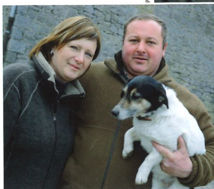
La Ferme Château de Laneffe, à Laneffe